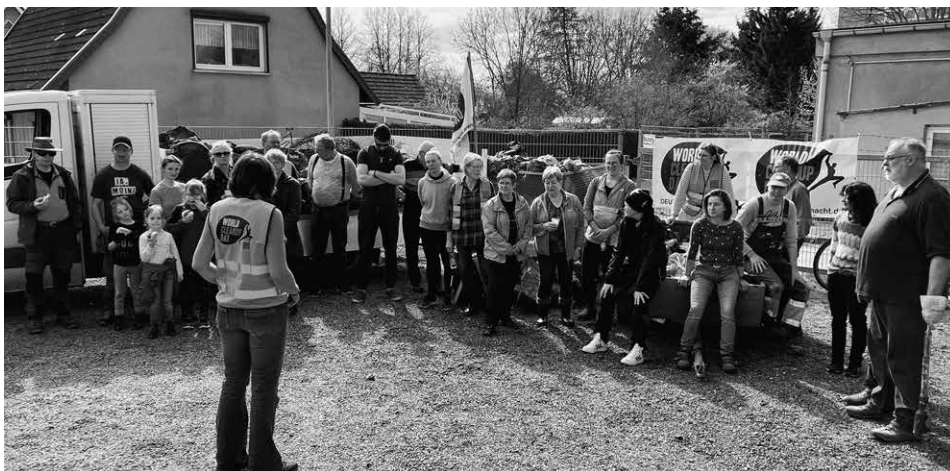
Abschlussbesprechung 2024 – im Hintergrund die drei vollen Anhänger