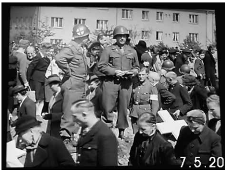
Zwei amerikanische Offiziere überwachen ihren angeordneten Vorbeimarsch Schweriner Bürger an den Leichen ermordeter KZ-Häftlingen (wie in Buchenwald).